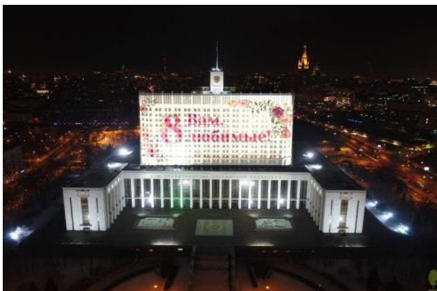
Дом правительства РФ